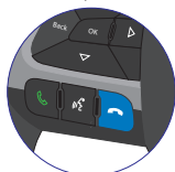
Tecla Phone Off